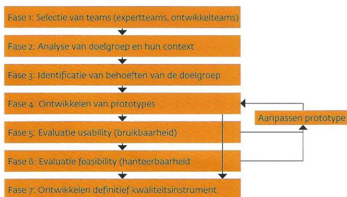
Schema 1: Fasen van het project

Cliëntparticipatie is gewaarborgd op verschillende niveaus en manieren in alle fasen van het project. In schema 2 wordt de cliëntparticipatie weergegeven per fase van het project. Hierbij wordt onderscheid gemaakt in de verschillende groepen van cliënten of ervaringsdeskundigen die deelnemen aan het onderzoek. Er zijn cliënten betrokken in het onderzoek vanuit een ontwikkelteam, een expertteam en als onderzoeksparticipanten.